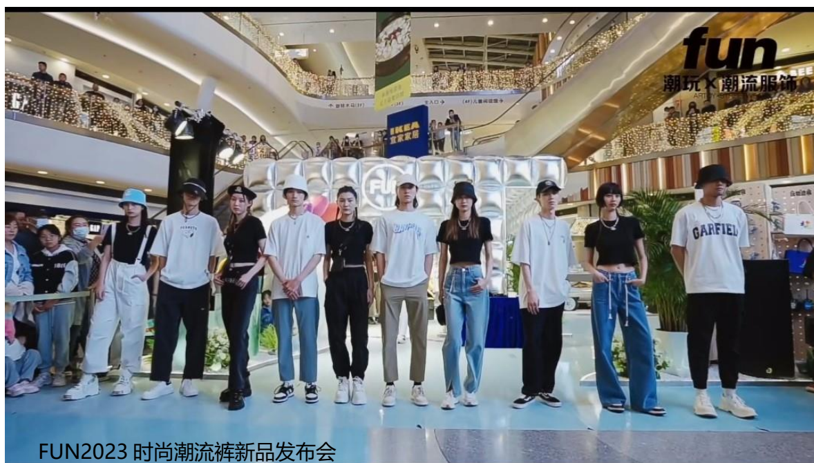
FUN2023 时尚潮流裤新品发布会

报告期内，FUN 品牌持续进行渠道结构的优化升级，升级第五代形象店铺，提升店铺形象及店效；品牌方面，通过“天工开物”国风限定快闪活动、“玩物造裤”快闪活动吸引众多博主、达人到访打卡；产品方面，强化商品企划，聚焦核心优势品类T恤，同时聚焦裤单品，于报告期内发布 FUN2023 时尚潮流裤新品，潮流与时尚、舒适与酷感兼备的各类潮裤新品惊艳亮相。